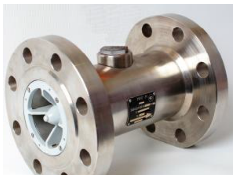
Рисунок 2 – Общий вид преобразователя первичного преобразователей расхода турбинных МИГ-М

Архангельск (8182)63-90-72 Астана (7172)727-132 Астрахань (8512)99-46-04 Барнаул (3852)73-04-60 Белгород (4722)40-23-64 Брянск (4832)59-03-52 Владивосток (423)249-28-31 Волгоград (844)278-03-48 Вологда (8172)26-41-59 Воронеж (473)204-51-73 Екатеринбург (343)384-55-89 Иваново (4932)77-34-06