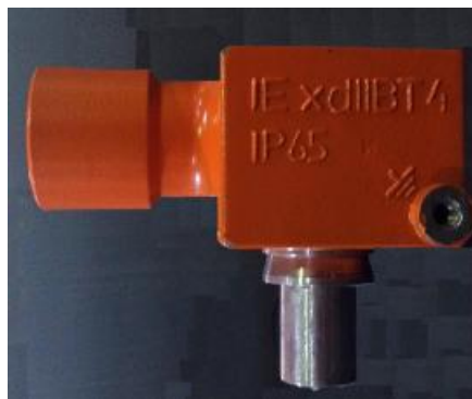
Рисунок 3 – Общий вид датчиков магнитоиндукционных НОРД-И2Д-У преобразователей расхода турбинных НОРД, МИГ-М

Пломбирование преобразователей расхода турбинных НОРД, МИГ-М осуществляется нанесением знака поверки давлением на специальную мастику, расположенную в чашечке винта крепления платы датчика магнитоиндукционного НОРД-И2Д-У и ударным методом на табличке, прикрепленной к преобразователю первичному преобразователей расхода турбинных НОРД, МИГ-М.