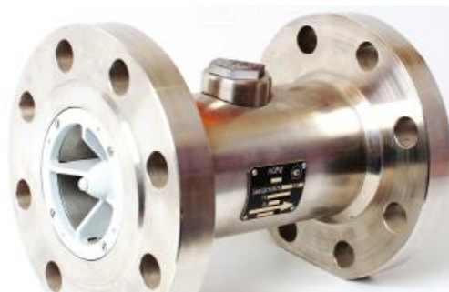
Рисунок 1 – Общий вид преобразователя первичного преобразователей расхода турбинных НОРД

Общий вид преобразователя первичного преобразователей расхода турбинных НОРД приведен на рисунке 1. Общий вид преобразователя первичного преобразователей расхода турбинных МИГ-М приведен на рисунке 2. Общий вид датчиков магнитоиндукционных НОРД-И2Д-У преобразователей расхода турбинных НОРД, МИГ-М представлен на рисунке 3.